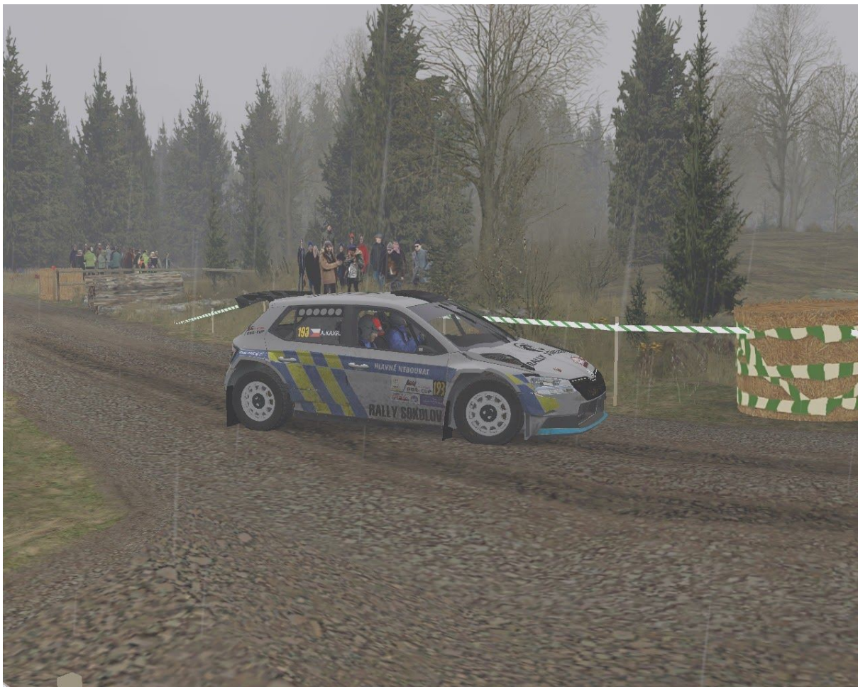
RALLY Team Sokolov